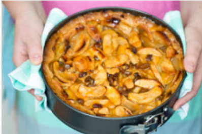
Een product met appels: appeltaart!

Appels worden vaak rauw gegeten. Handappels noemt men dat. Elstar en Jonagold zijn op dit moment de populairste handappel rassen. Een kwart van de appels uit Nederland wordt in fabrieken verwerkt tot appelmoes.